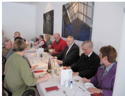
Das Mittagessen ist vorzüglich