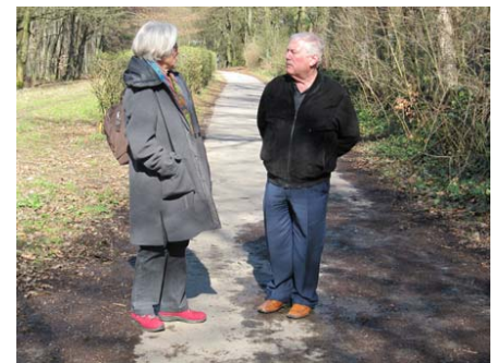
Pausenspaziergang bei strahlender Sonne