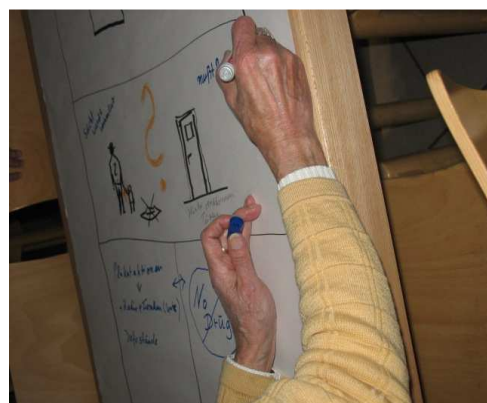
Gruppenarbeit der Weggefährten 1