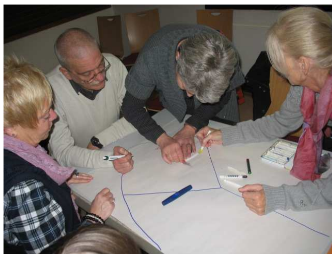
Gruppenarbeit der Weggefährten 2

krankmachend. Die Kinder von alkoholkranken Menschen sind 7-mal häufiger gefährdet selbst abhängig zu werden oder psychisch zu erkranken.