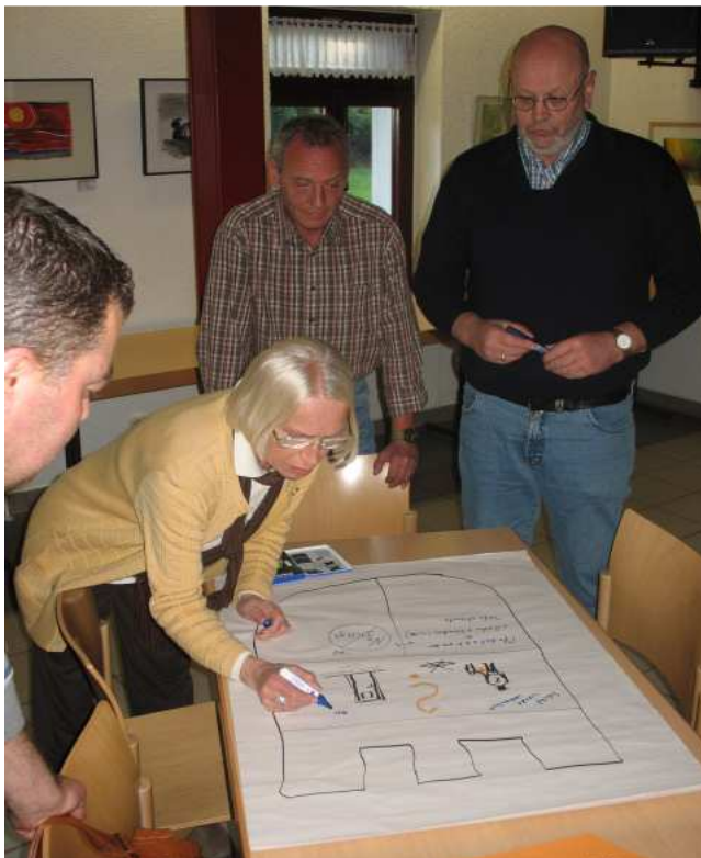
Gruppenarbeit der Weggefährten 4

So verschieden die Suchtselbsthilfe und die Suchtvorbeugung auch sind, in einem Ziel stimmen sie überein: Suchtkrankheit sollte gar nicht erst entstehen und dafür setzen sie sich ein.