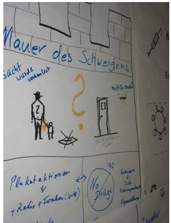
Gruppenarbeit der Weggefährten 5